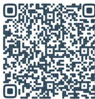
Ссылка на трансляцию мероприятия