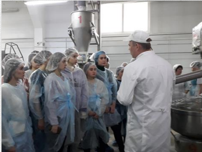
Экскурсии на предприятия