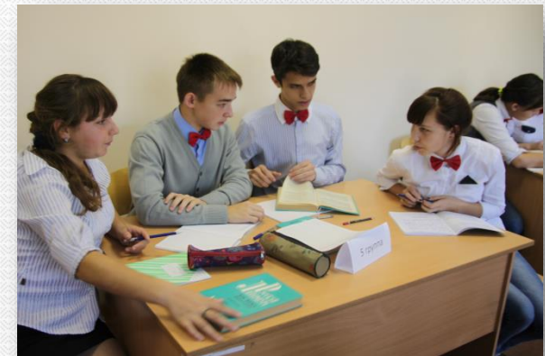
Проф. направленность теоретического обучения