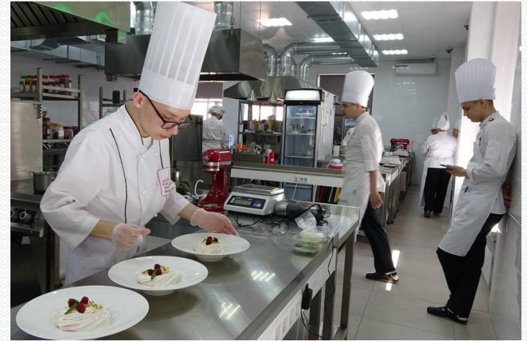
Участие в чемпионатах