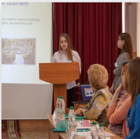
Круглый стол с работодателями. Выступающие