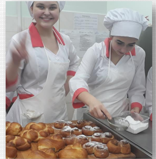
Практика в колледже