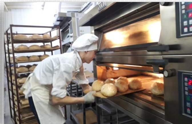
Практика на производстве