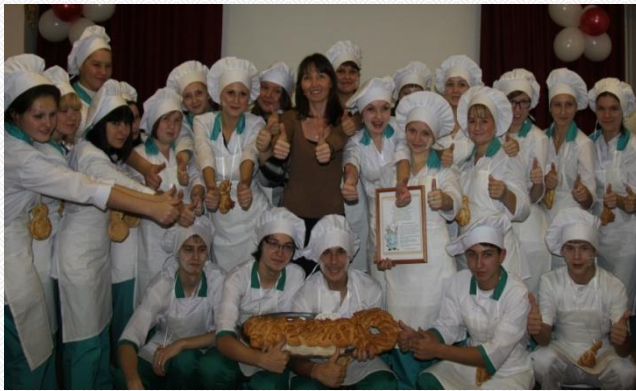
«Посвящение в профессию Пекарь»