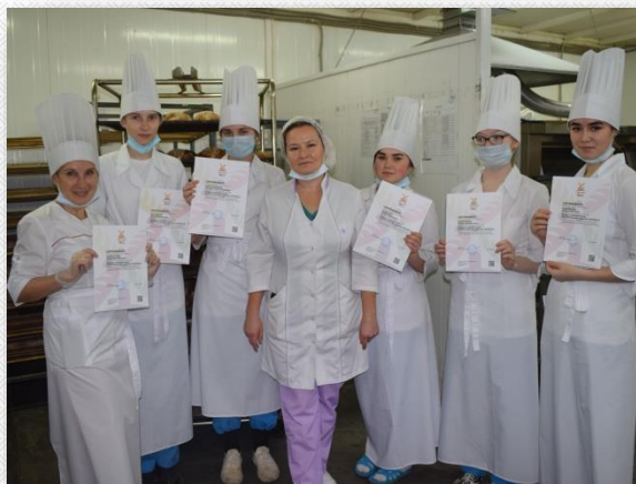
Участие в конкурсах