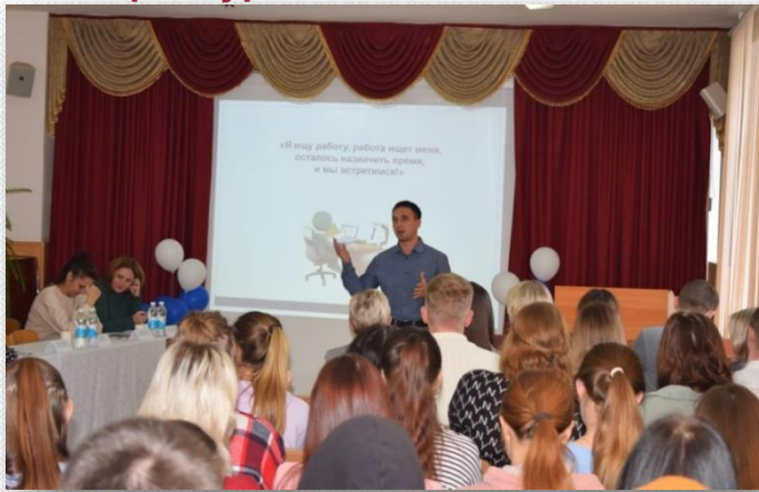
Встречи с выпускниками колледжа - работодателями